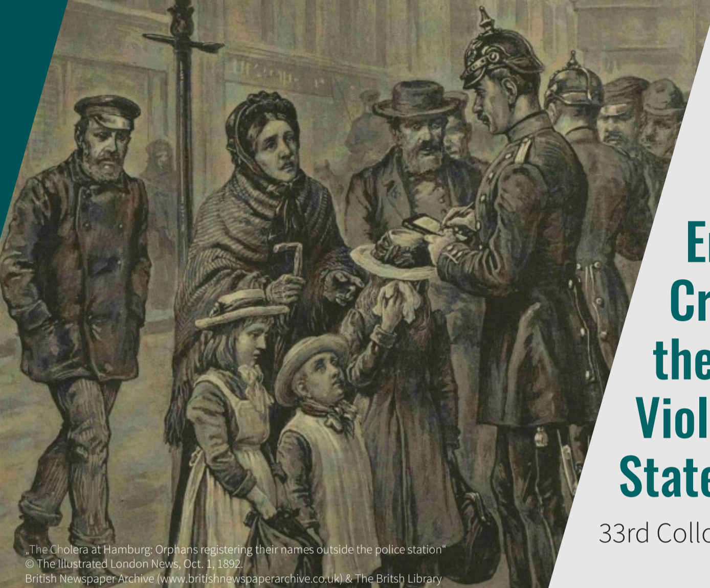
„The Cholera at Hamburg: Orphans registering their names outside the police station“